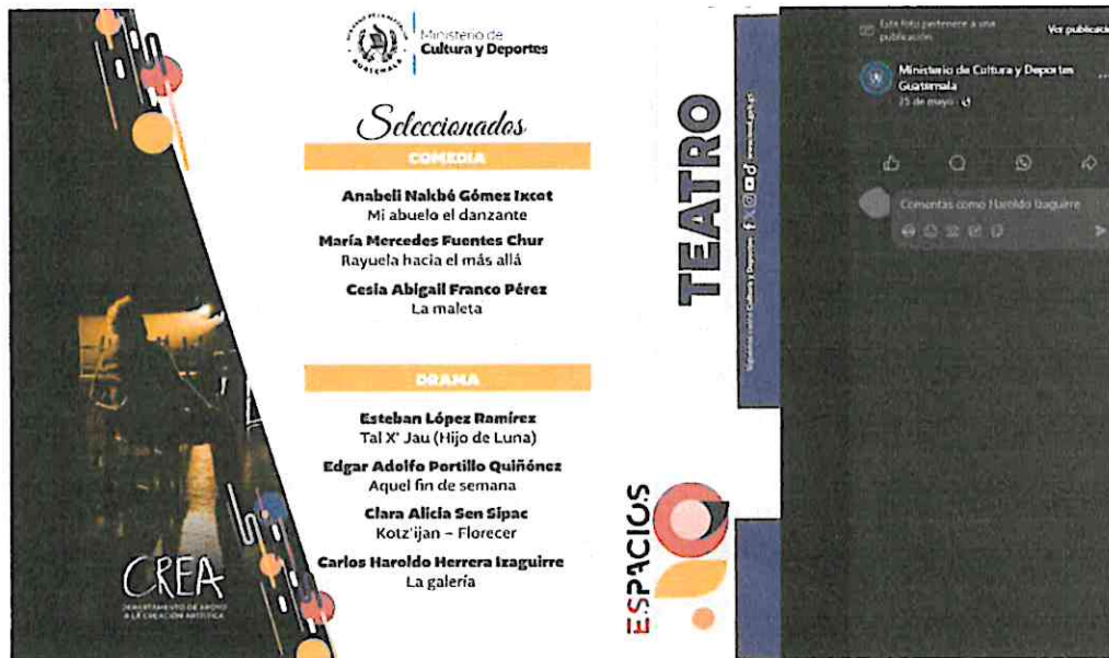
(Publicación de la página de Facebook del Ministerio de Cultura y Deporte, presentando el montaje “La Galería” como seleccionada en “ESPACIOS 2024”).