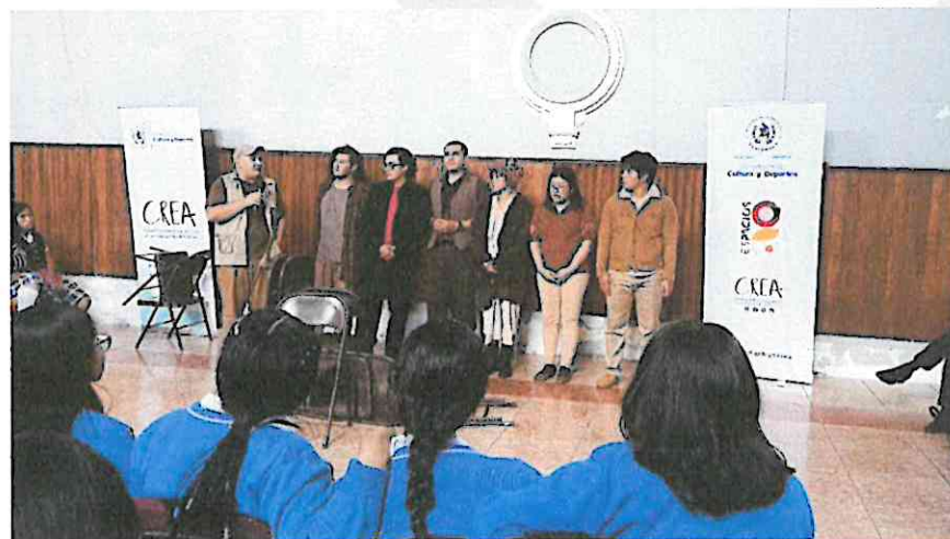
(Segunda presentación de la obra "La Galería" en el Instituto Normal Central para Señoritas Belén, como parte del proyecto "ESPACIOS 2024")