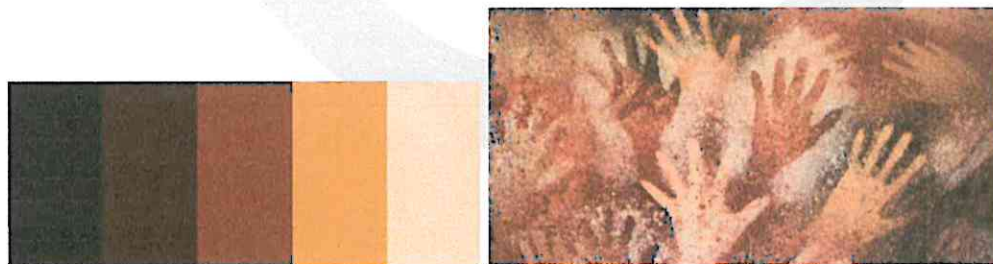
(Referencia de paleta de colores). (Pintura rupestre, Cueva de las manos, Argentina).

La paleta de colores utilizada, tanto en el vestuario como en la escenografía, se basó principalmente en las pinturas rupestres como las primeras pinturas artísticas en el mundo.