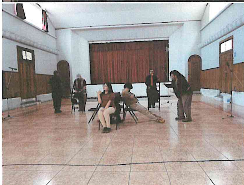
(Presentación de "La Galería" en el Instituto Normal Central para Señoritas Belén, para ESPACIOS 2024).