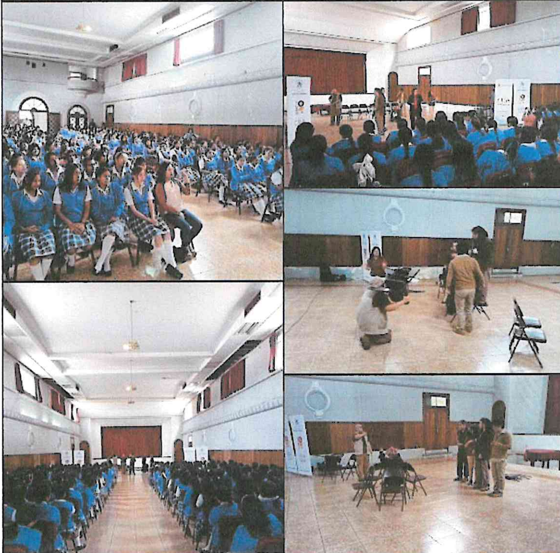
(Publicación de la página de Facebook del Departamento de Apoyo a la Creación Artística -CREA- de la primera presentación de "La Galería" en el Instituto Normal Central para Señoritas Belén, 04 de septiembre del 2024).