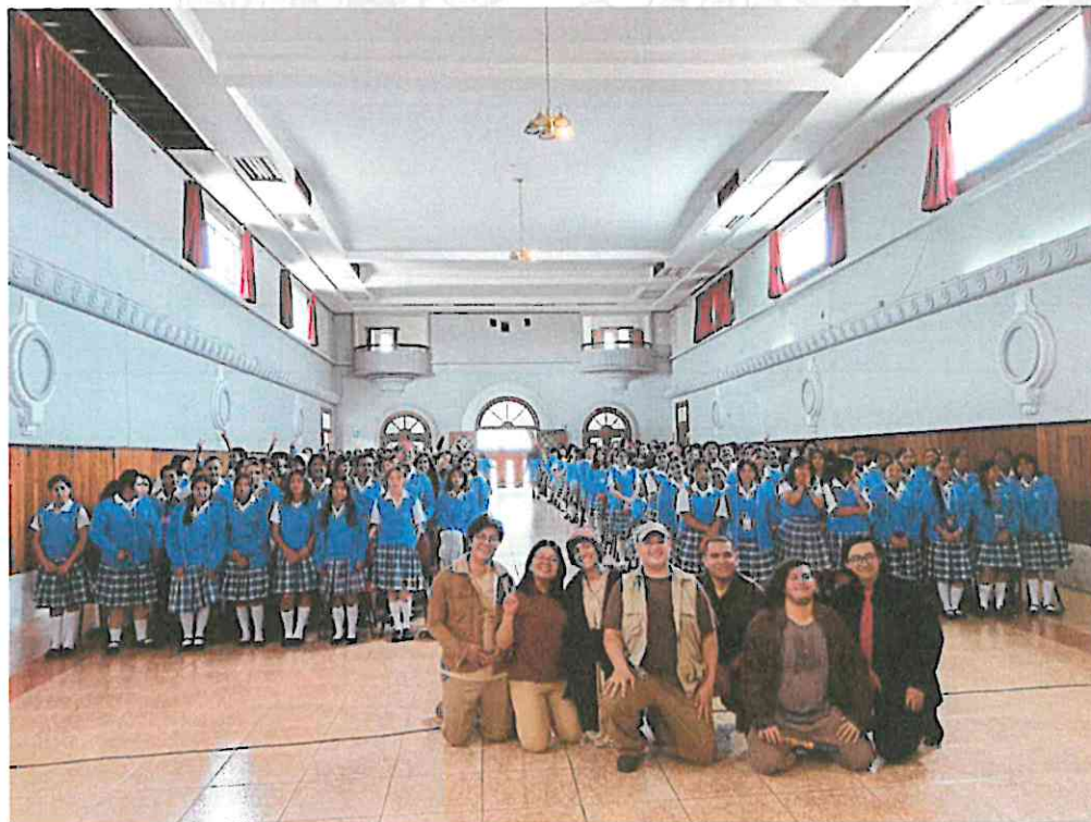
(Presentación de "La Galería" en el Instituto Normal Central para Señoritas Belén, para ESPACIOS 2024).