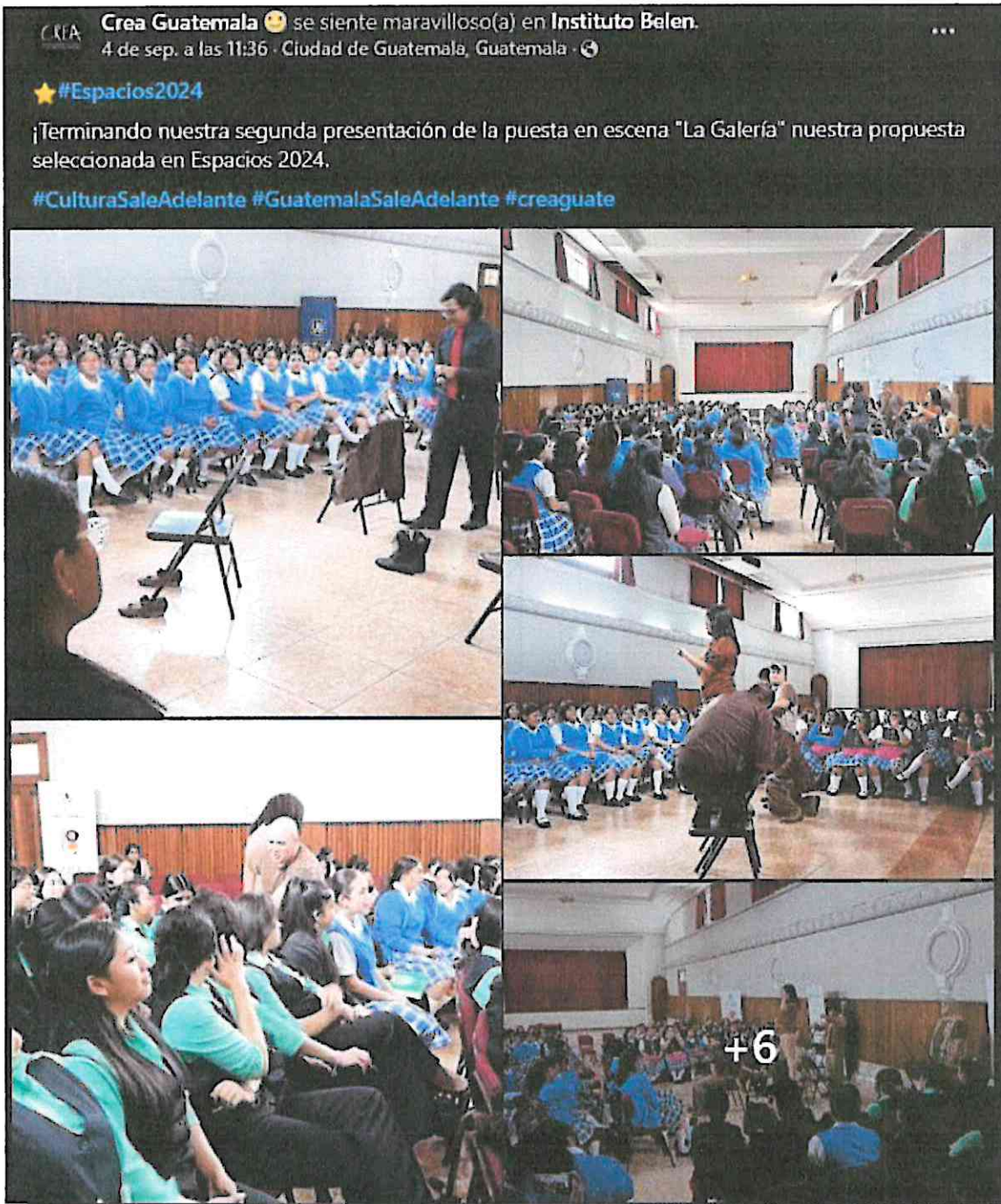
(Publicación de la página de Facebook del Departamento de Apoyo a la Creación Artística -CREA- de la segunda presentación de "La Galería" en el Instituto Normal Central para Señoritas Belén, 04 de septiembre del 2024).