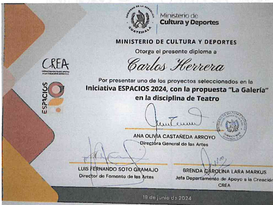
(Diploma del Ministerio de Cultura y Deporte entregado por la selección de “La Galería” en la inauguración de “ESPACIOS 2024”, 19 de junio del 2024).