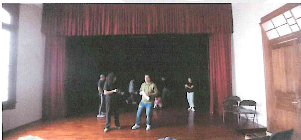
(Trabajo de mesa y ensayo de "La Galería" en el Teatro de Arte Universitario).