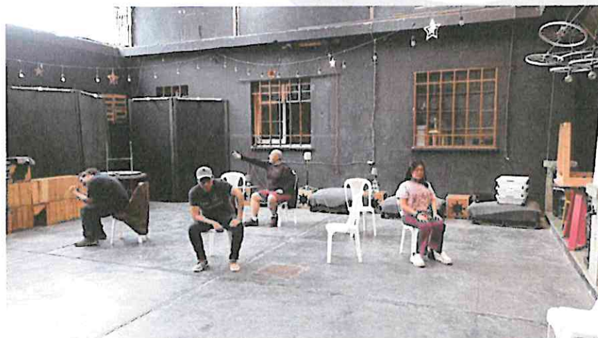
(Ensayo de "La Galería" en el Centro Cultural "La Casona", zona 1).